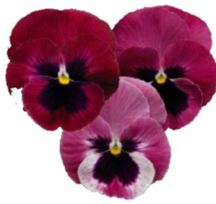
Light Rose Blotch