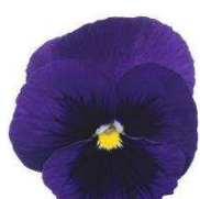
Deep Blue with Blotch Imp