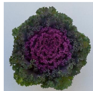
Bright and Early Red