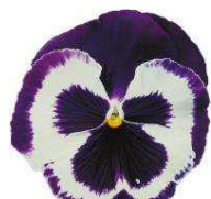
Blue & White Imp