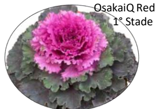
OsakaiQ Red 1 st Stade