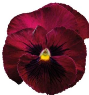
Deep Rose Blotch