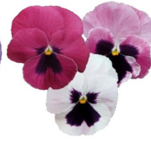
Pink Surprise Blotch