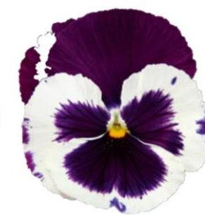
White Violet Wing