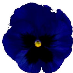
Deep Blue Blotch