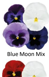
Blue Moon Mix