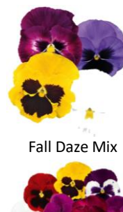
Fall Daze Mix