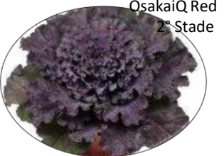
OsakaiQ Red 2 nd Stade