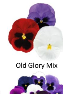
Old Glory Mix