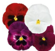
Wine &amp; Roses Mix