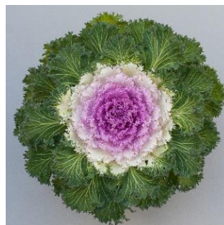
Bright and Early Bicolour