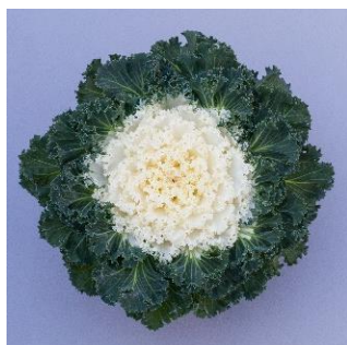
Bright and Early White